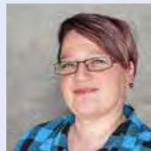
Jasmin Scalia Catering